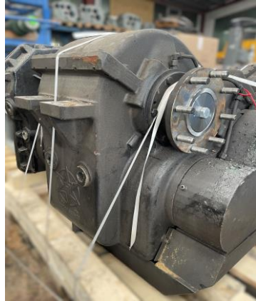
Ankunft des Getriebes