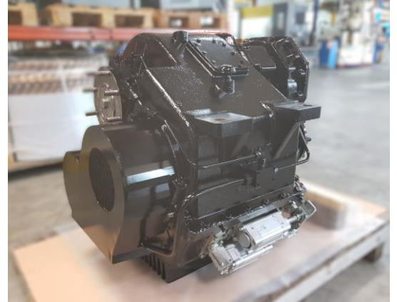
Nach der Aufbereitung