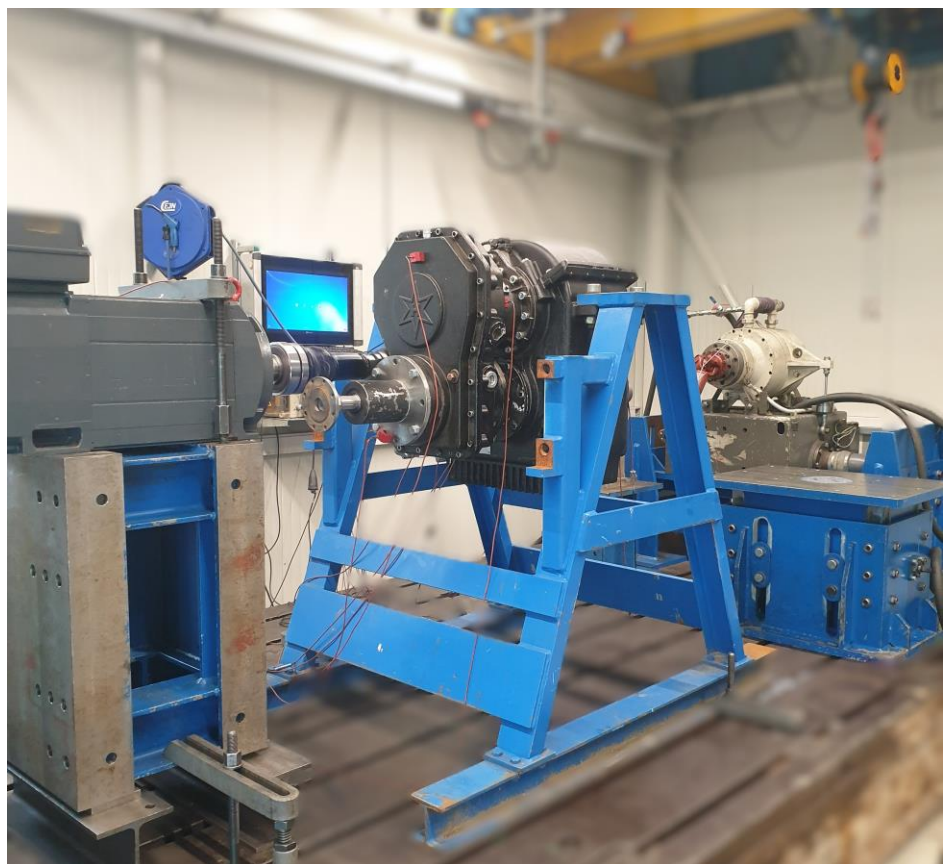
Wendegetriebe eines Arbeitszuges mit Vorgelegegetriebe auf unserem Prüfstand